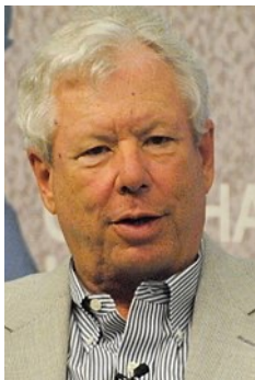
Richard H. Thaler

2017. aastal pälvis Thaler Nobeli majandusauhinna oma panuse eest käitumisökonomikasse.